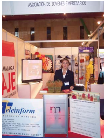
Stand de AJE, en el que se presentó Melior

empresariales de España y Marruecos. Melior estuvo también presente en la I Feria Empresarial Hispano-Marroquí a través que la AJE (Asociación de Jóvenes Empresarios) colocó en el certamen, el cual registró a su finalización un total de 31.250 visitas, de las cuales 3.000 fueron profesionales acreditados.