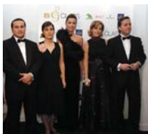
Equipo de dirección B&C

Esta publicación, perteneciente a TDM Company, empresa dedicada al diseño y la comunicación desde 1997, nace como un proyecto ambicioso en 2003, con el objetivo de crear una línea editorial. Tras diez meses de intenso trabajo, en enero de 2004 se lanzó el primer número de B&C, cubriendo así la demanda de un público muy determinado y que hasta ahora no cubría ninguna otra revista.