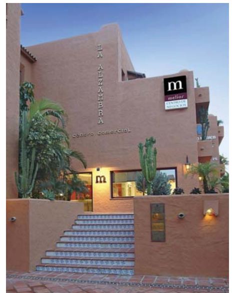
Entrada del Centro de Negocios Melior Vasari.

Melior Vasari fue inaugurado la noche del diez de diciembre de 2004 con una fiesta a la que asistió la Junta Directiva de Melior, altas autoridades de la