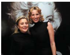
Las organizadoras del evento

El objetivo prioritario en el que trabaja B&C es "orientar al usuario en las diferentes posibilidades de ocio de lujo que tiene nuestro país, además de ofrecer una lectura interesante, actual y también informativa y de calidad". De este modo, se ha desarrollado en este primer año en base a unas notas de exclusividad tales como su posicionamiento como producto de alto standing; aportar más actualidad y contenido interesante al lector, con las primas de calidad, originalidad, veracidad y exclusividad; y aportar la mayor calidad a sus materiales, un exclusivo tratamiento de imágenes y textos, más un formato totalmente novedoso.