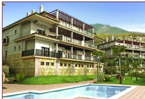
Muestra de una reproducción virtual de un proyecto inmobiliario.

Los clientes de la empresa a la que nos referimos, gozan de gran prestigio en el mercado inmobiliario