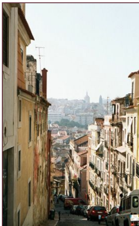
Rincón de Lisboa, ciudad de interés para Melior

de la Castellana, con 27 despachos y 2 salas de reuniones, ofrece a empresas profesionales un entorno de trabajo idóneo con la imagen, instalaciones y equipo humano adecuado a sus necesidades para comenzar su actividad.