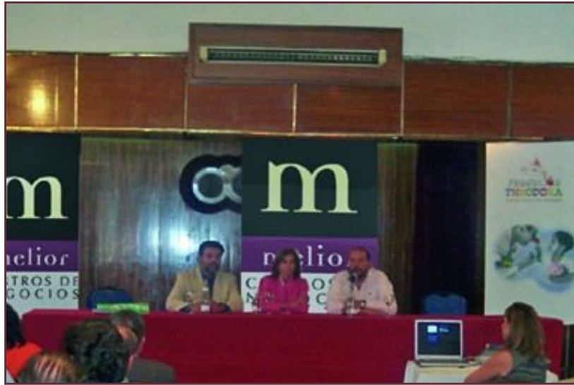
Acto de firma de colaboración entre Melior y la Fundación Theodora.

La fundación trabaja en esta labor desde hace más de once años, encontrándose actualmente presente en nueve países donde