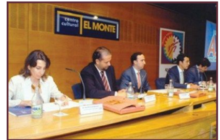
Asamblea general en su 10º aniversario.

En la jornada de trabajo que contó con el apoyo de personal de Melior, se entregó material promocional de los Centros de Negocios Melior a los empresarios asistentes a la Asamblea.