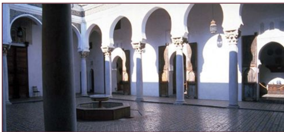
Tánger. Ciudad que acogió el "Encuentro Empresarial del Sector de la Franquicia"

En el año 2004, Melior confirma su liderazgo dentro del mercado de los centros de negocios, con la apertura en pleno corazón de Azca, de Melior Madrid. Este centro de 850 metros cuadrados ubicado en el Paseo