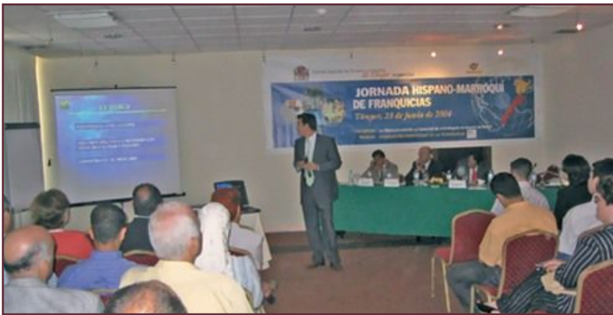
Momento de la jornada en el que se estudiaron las ventajas empresariales del país vecino.

Los días 23 y 24 del pasado mes de junio, tuvo lugar en la ciudad marroquí de Tánger el "Encuentro Empresarial del sector de la Franquicia" promovido por la Cámara de Comercio Española. Melior estuvo presente en este evento a través de la Federación de Franquiadores de Andalucía (FRANCA), asociación de la que es miembro.