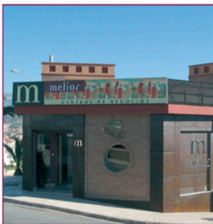
Fachada Centro Melior Axarquía

“Un centro de negocios situado en pleno corazón de la Costa del Sol Oriental”