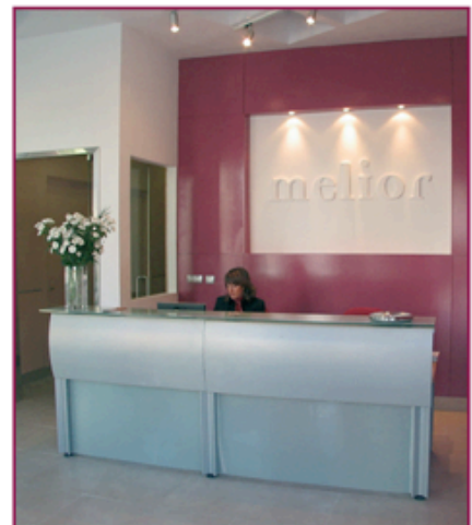
Recepción Melior Axarquía

En el Centro Melior Axarquía, y a través de diversas acciones, se ha tratado de enfocar todo el esfuerzo de comunicación en despertar la demanda latente en el tejido empresarial de la comarca y alrededores, con apariciones en diversos medios, tanto escritos como en televisión, así como con presencia constante en diversas ferias, actos y eventos.